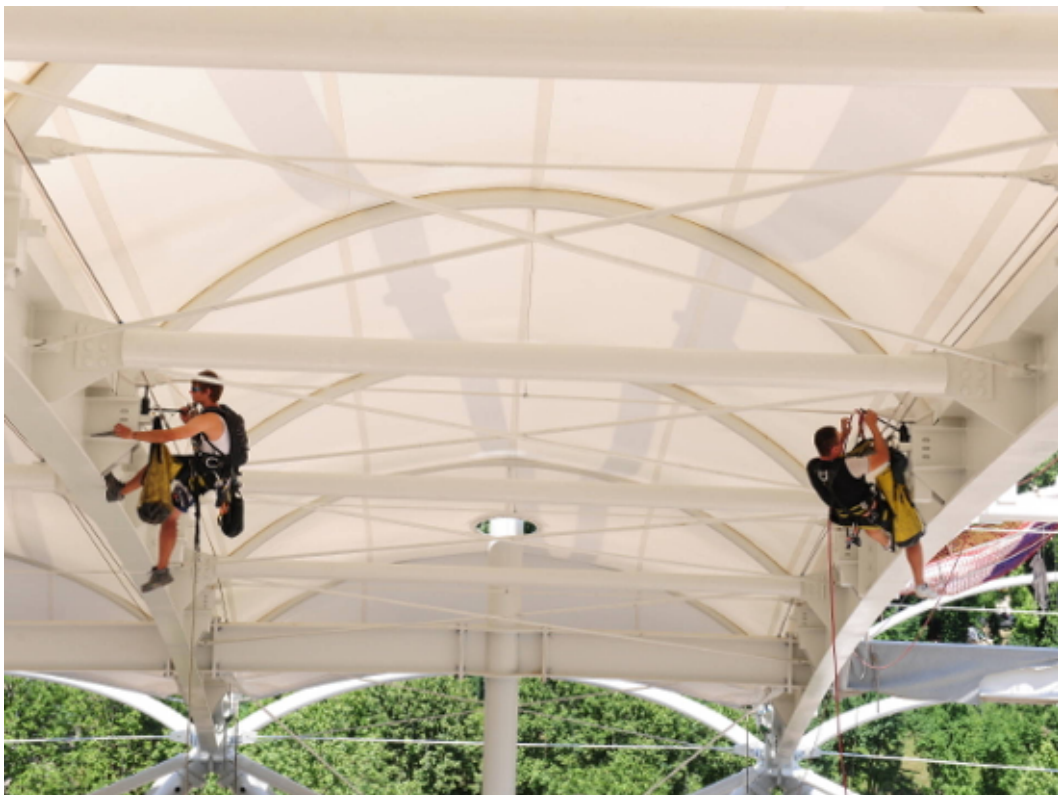
Montage Membranbau CENO TEC

Die SATTLER Gruppe wurde 1875 von August Sattler gegründet und wird bis heute von der Familie in fünfter Generation geführt. Die Geschichte des Familienbetriebes spiegelt die historische und ökonomische Entwicklung Europas. Waren es zu Beginn Textilien für die österreichischen Feuerwehren, so konzentrierte man sich schon bald auf die Entwicklung und Fertigung von textilen Sonnenschutzgeweben. Bereits 1900 produzierte man in Gössendorf Segeltuch- und Schläuche auf je zehn Webstühlen. 1917 wurde der Standort in Rudersdorf erworben, wo sich bis heute die Weberei der Sattler SUN-TEX GmbH befindet.