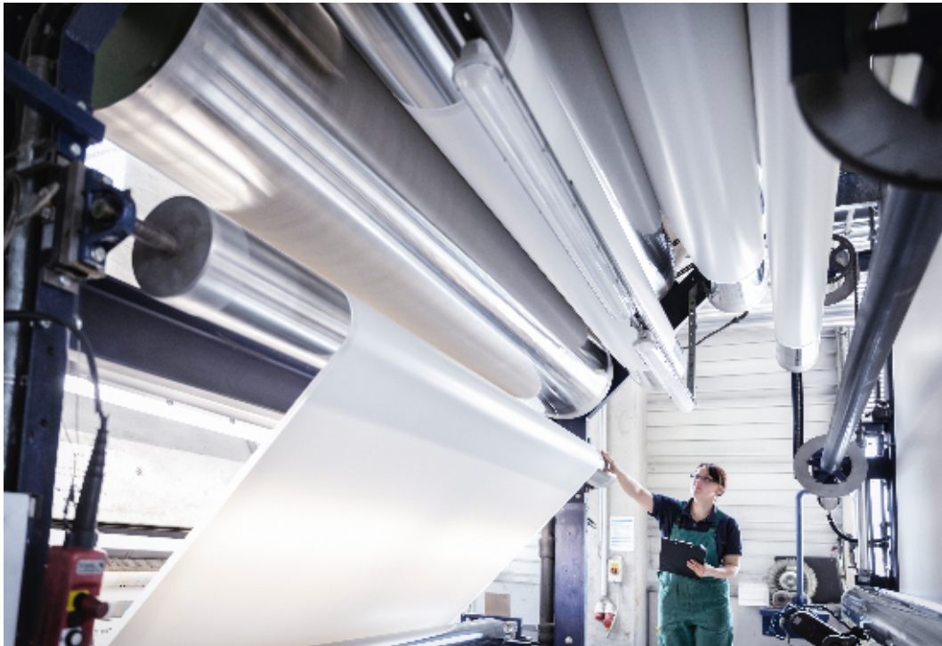
Sattler Werk Gössendorf, Österreich