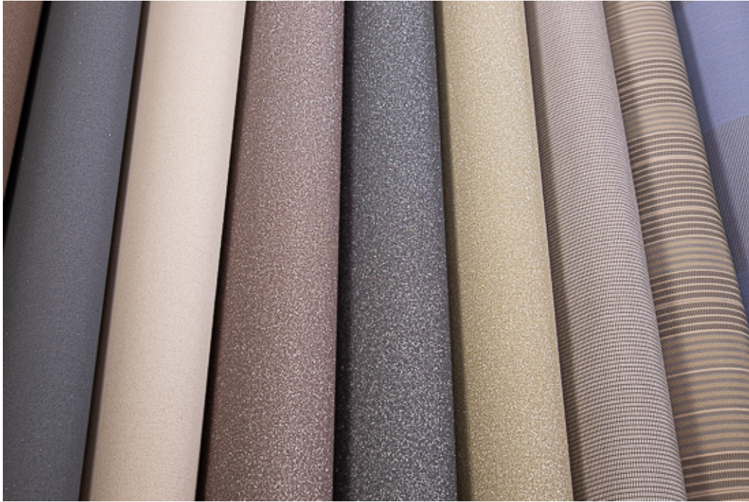
SUN-TEX LUMERA, Twilight Metal und LUMERA 3D Muster in der SBCZ Materialsammlung

Mit den Markisenstoffen LUMERA und LUMERA 3D bietet Sattler Sun-Tex zudem eine hochwertige Premium Markisenstoffkollektion an. Diese Gewebe zeichnen sich durch Ihre brillanteren Farben und der geringeren Schmutzanfälligkeit aus. Durch die Verwendung des glänzenden CBA-Garn und dem texturierten Stapelfasergarn wird eine glatte Oberfläche oder, bei Lumera 3D, eine dreidimensionale Struktur erreicht. Das CBA-Garn ist eine Entwicklung von Sattler Sun-Tex. «Clean Brillant Acrylic» ist ein glattes, glänzendes Acrylgarn, welches die Farben leuchtend und klar wirken lässt und die Anschmutzung verringert.