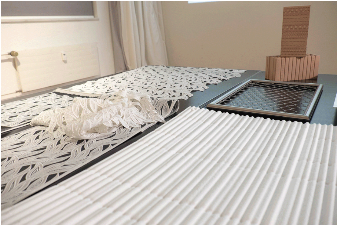
TREFFPUNKT Gestaltung im Handwerk «Adaptionen», 8. November 2018