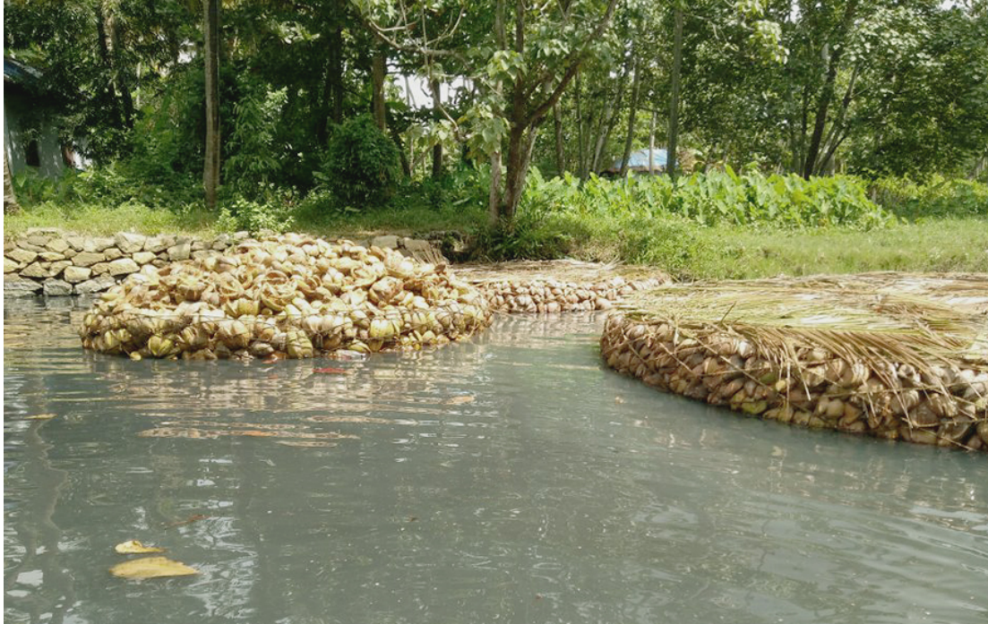
Kokosinseln zur Extraktion der Kokosfasern

Dieser «Röstvorgang» dauert ungefähr 8-10 Monate. Hierbei verändert sich auch die Farbe der Kokosfaser zu einem goldgelben Farbton.