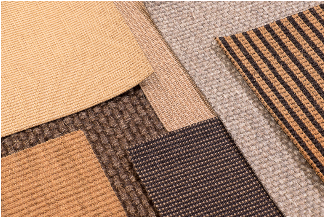
Sisal- und Kokosteppiche von Terr'Arte neu in der SBCZ Materialsammlung

Die Naturfasern Kokos und Sisal weisen beide sehr robuste Eigenschaften auf. Sie sind sowohl strapazierfähig wie auch beständig gegen Feuchtigkeit und Fäulnis. Die Firma Terr'Arte bietet eine grosse Vielfalt an Teppichen aus den beiden Fasern an. Neu sind diese Teppiche in der SBCZ Materialsammlung zu finden.