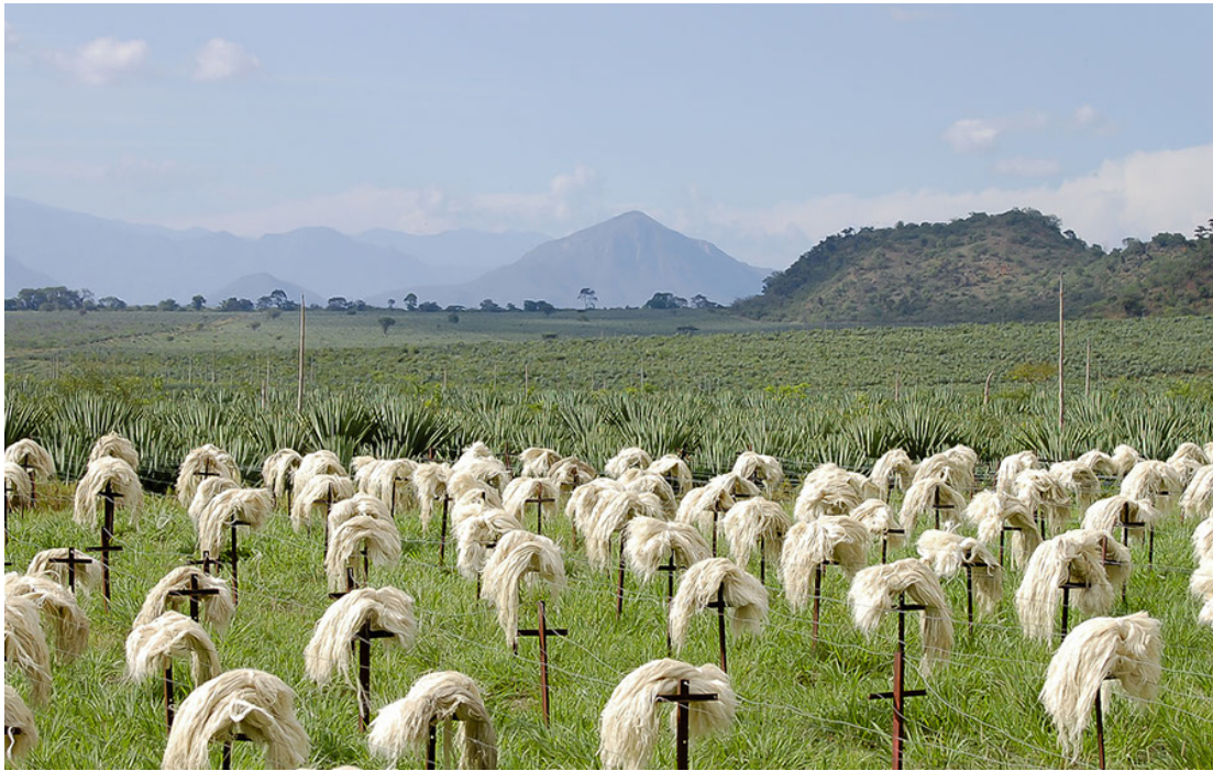
Sisalfasern und die Agaven im Hintergrund