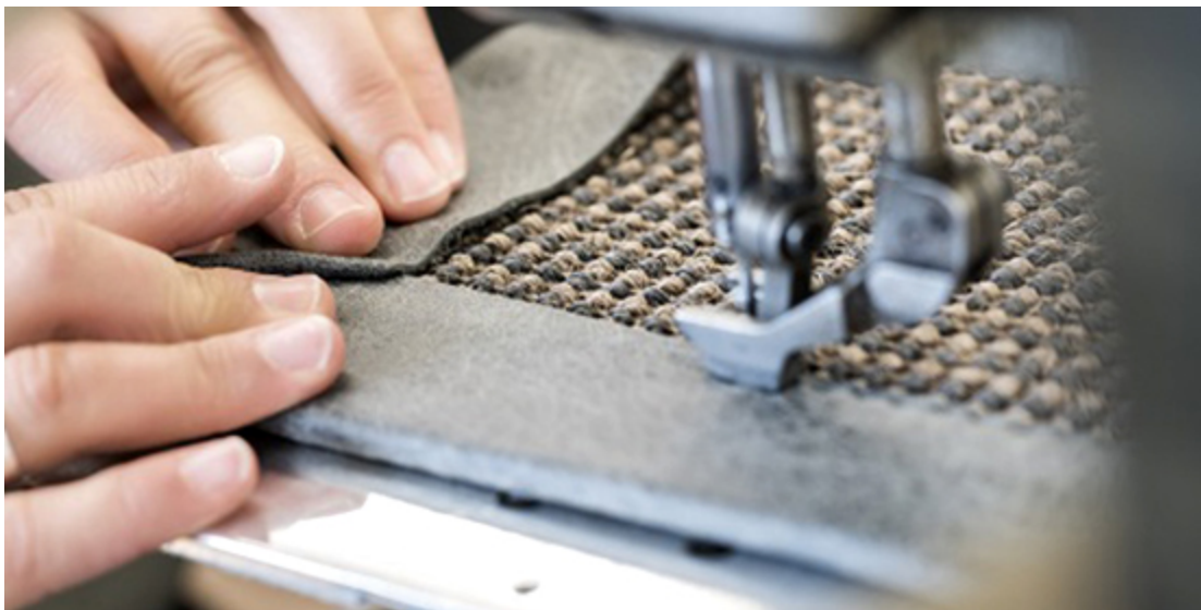
Randabschluss eines Sisalteppichs mit Bordüre

Die Sisalfaser hat im Rohzustand eine fast weisse Farbe. Durch Einfärbungen oder in Kombination mit andern Fasern kann eine breite Palette von Oberflächen hergestellt werden. Die Sisalfasern sind mit ca. 70-100 cm wesentlich länger als Kokosfasern. Sie lassen sich durch ihre Länge sehr gut maschinell verspinnen und man erzielt damit eine hohe Reissfestigkeit. Kokosteppiche enthalten daher oft auch einen Anteil Sisal. Sowohl Kokos als auch Sisalfasern sind hygroskopisch. Je nach Raumfeuchtigkeit kann sich die Faser dehnen oder zusammenziehen. Die Terr'Arte AG bietet die Teppiche in Form von Bahnen oder Fliesen als ganzflächigen Bodenbelag oder als Teppich in gewünschter Form, mit einer grossen Auswahl an Bordüren oder anderen Randabschlüssen an.