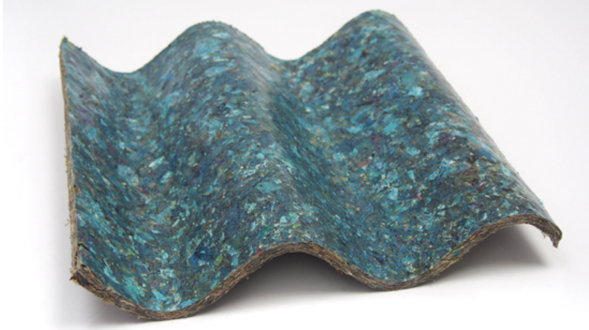
Tuff Roof aus Abfall Tetra Pak Kartons von Daman Ganga Paper Mill, Gujarat, Indien (reconfigured)

In einem weiteren Schritt werden die Produkte und Projekte nach ihren Einsatzmöglichkeiten im Tragwerk, als selbsttragende Elemente, für Wärmedämmung und Feuchteschutz sowie im Ausbau gegliedert und dargestellt.