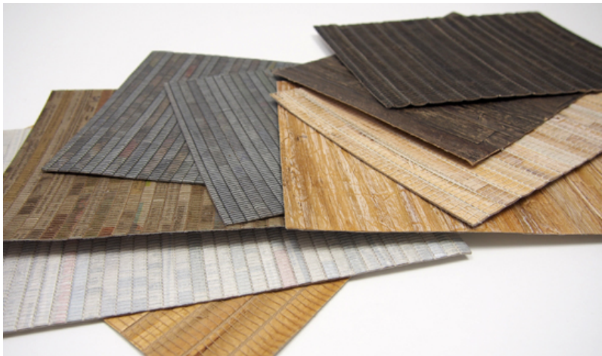
Natura 2 Finishing Panels aus Wasserhyacinthen von La Casa Deco, Manila, Philippines (reconfigured)

Die Bandbreite der dargestellten Baustoffe reicht von marktgängigen Produkten, wie Fassadepaneele aus Stroh oder selbstheilendem Beton, bis hin zu Neuentwicklungen wie Holzbaulemente aus Zeitungspapier oder Isolierfasern aus Jeansdenim. Die Produkte werden im Buch alle auch in ihrer Anwendung in gebauten oder prototypischen Projekten gezeigt.