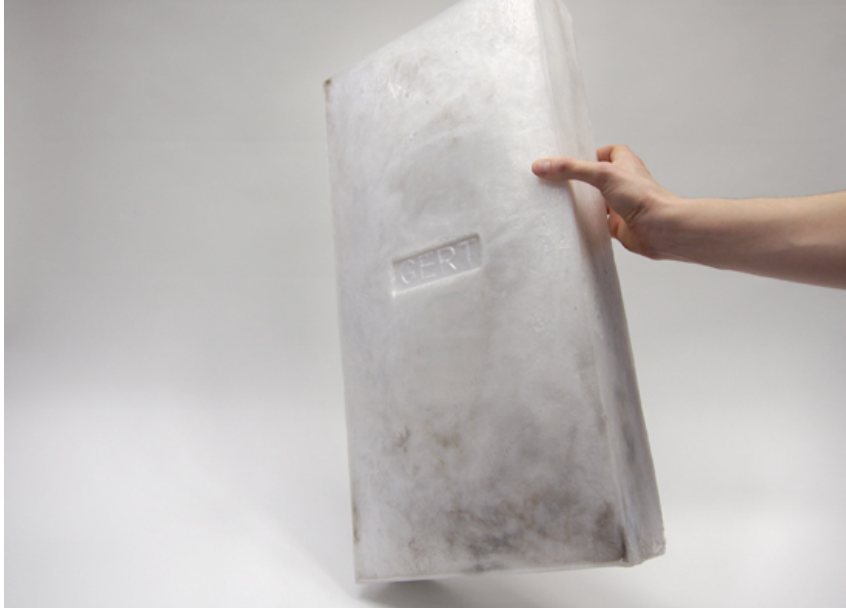
Recy Blocks aus Abfallplastik von Gert de Mulder, Hetogenbosch, The Netherlands (transformed)

Die Bandbreite der dargestellten Baustoffe reicht von marktgängigen Produkten, wie Fassadepaneele aus Stroh oder selbstheilendem Beton, bis hin zu Neuentwicklungen wie Holzbaulemente aus Zeitungspapier oder Isolierfasern aus Jeansdenim. Die Produkte werden im Buch alle auch in ihrer Anwendung in gebauten oder prototypischen Projekten gezeigt.