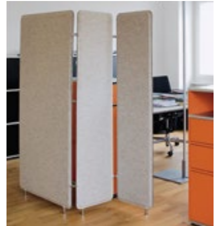
Ruckstuhl «Pannelo Paravent».