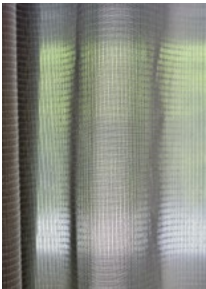
Transparenter Akustikstoff «Betacoustic» von Création Baumann.