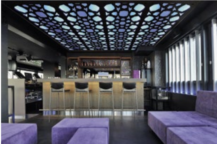
Bruag-Akustikelemente im Club «L'Etage» in Wil SG.