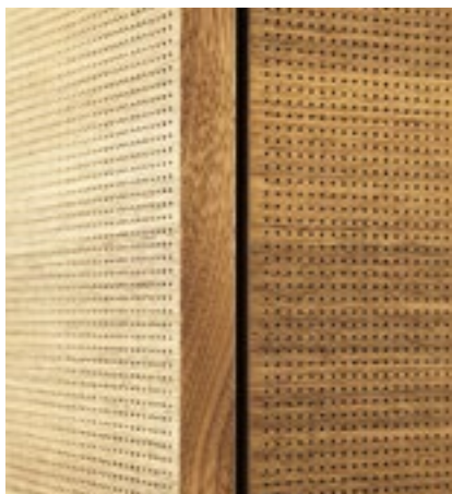
Neuer, mikroperforierter Absorber mit Holzoberfläche von Strähle.