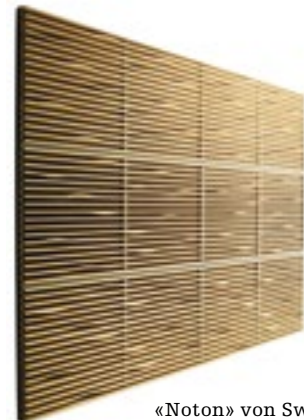
«Noton» von Swedese.