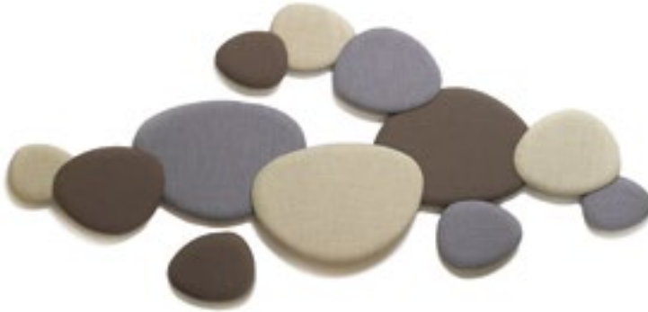
«Satellite» von Stua gibt es in vier Grössen und vielen Farben.