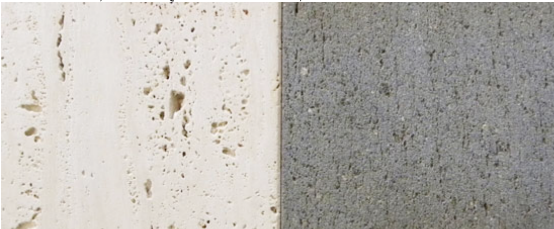
Travertin ungefüllt und Basaltgestein

Die heutzutage in Europa verwendeten Naturwerksteine kommen vorwiegend aus Indien, China, Südafrika, Brasilien, Italien, Türkei, Spanien und Skandinavien. Mit der über Jahrtausende praktizierten Nutzung von Natursteinen ist es üblich, die jeweilige Sorte nach dem Herkunftsort oder seiner Herkunftsregion zu benennen (z. B. Carrara Marmor, Pennsylvania Blue). In der Schweiz finden einheimischer Granit, Gneiss oder Quarzit aber auch Kalkstein, Sandstein und Schiefer wieder vermehrt Verwendung.