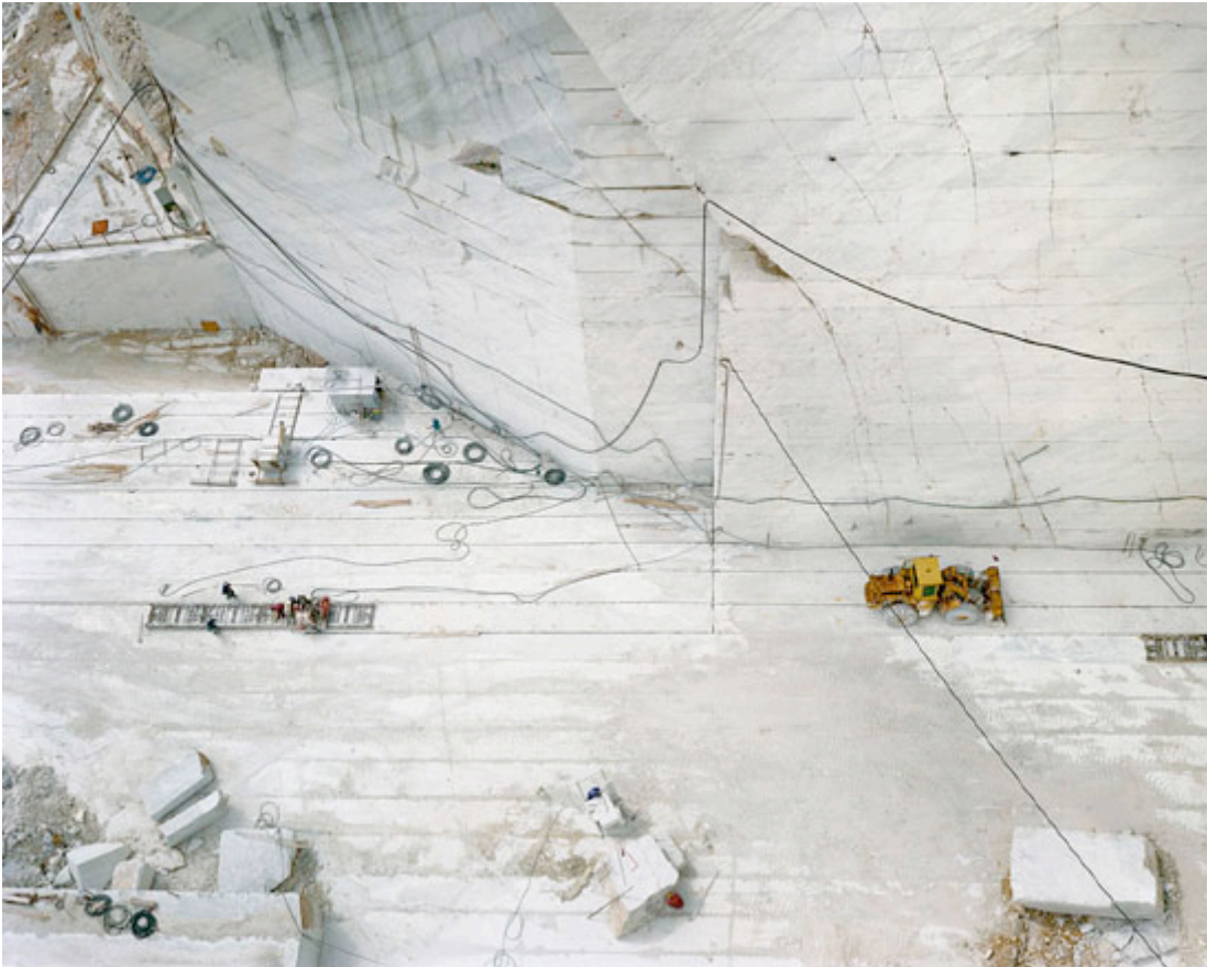
«Carrara Marble Quarries # 24»

Mineralogen und Geologen verwenden für Naturstein ausschließlich den Begriff Gestein; und sie definieren Gestein als ein «Gemenge von Mineralen». Naturstein als gesägtes oder behauenes Produkt wird als Naturwerkstein bezeichnet, und undimensionierter Naturstein als Bruchstein.