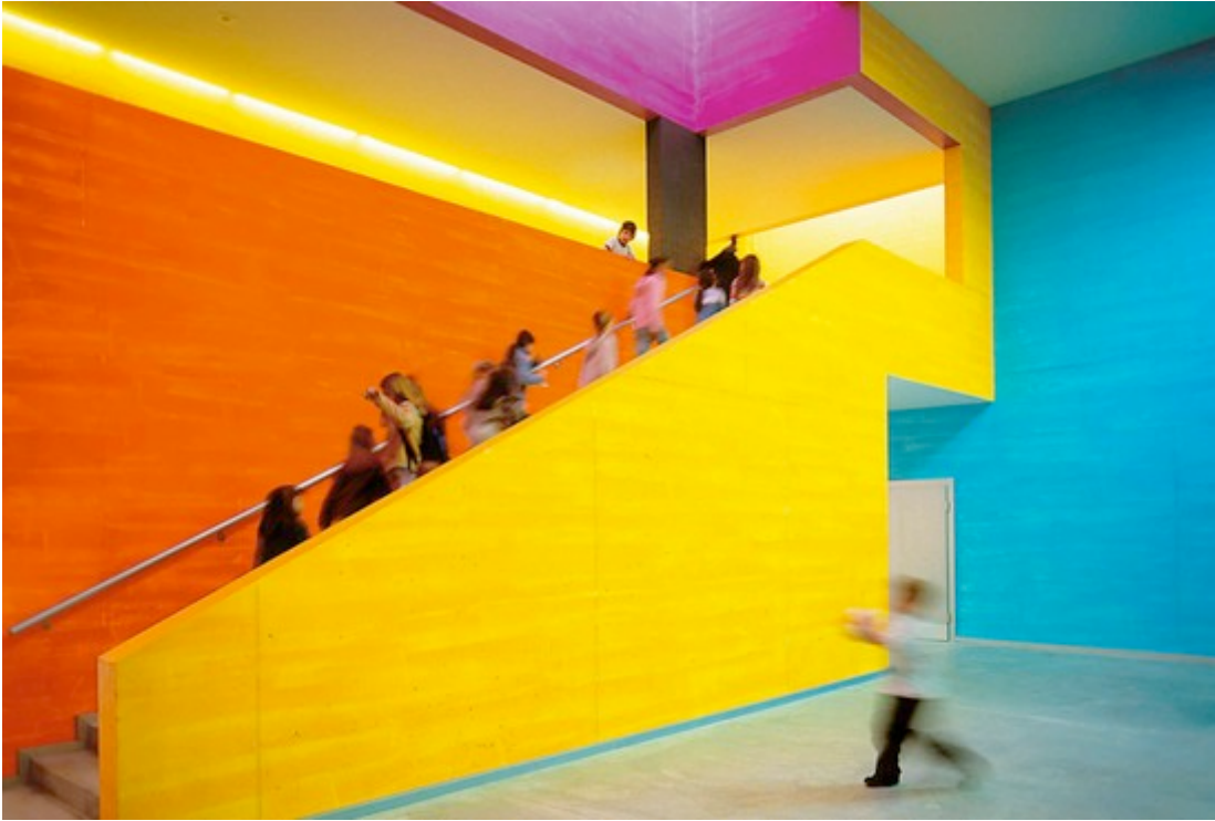
Schulhaus Scherr Zürich, Farbgestaltung Peter Roesch Luzern, Architektur 2002 Patrick Gmür