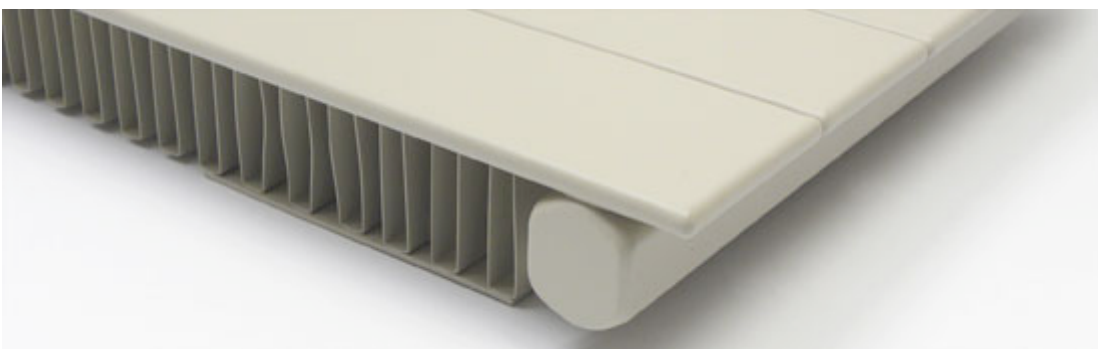
RUNTAL (Zehnder Group Schweiz AG) Radiatoren in der Option Claviers de Couleurs Le Corbusier

Die Fondation Le Corbusier in Paris verwaltet seit 50 Jahren das Werk Le Corbusiers und hat kürzlich die Rechte zur Weiterverbreitung der Farben an Les Couleurs Suisse AG vergeben. Les Couleurs ist ein Schweizer Unternehmen mit internationaler Ausrichtung und vermarktet den Brand «Le Corbusier Farbklavaturen» weltweit.