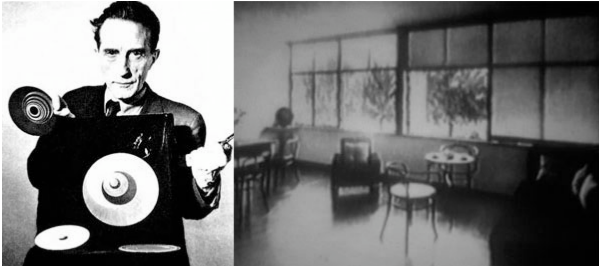
Bilder: Selbstportrait, Filmausschnitt Werkbundsiedlung Stuttgart 1927

Kostenloser Eintritt im Sinne der offenen Türen. Eine Voranmeldung ist nicht notwendig, der Kurzfilm wird laufend wiederholt. Wir freuen uns auf Ihr zahlreiches Erscheinen.