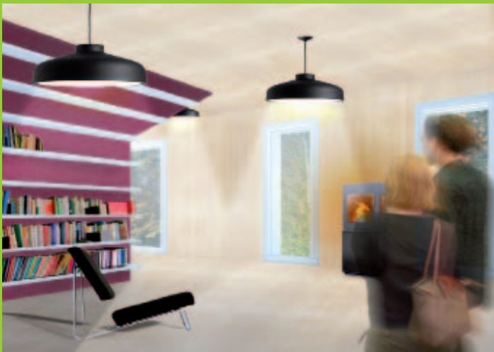
Zwei Renderings im Vergleich: oben noch ohne Texturen, unten mit den gekachelten Texturen von mtextur.com und der Baumaterialcentrale.

ihnen. Dieses Angebot erlaubt es, vergleichsweise hersteller- oder lieferantunabhängig zu entwerfen und zu planen. Ausserdem erspart die Recherche über die Baumaterialcentrale oder mtextur.com die manchmal etwas langwierige Suche auf den Internetseiten der Hersteller. Und es ist keine spezielle Registrierung für den Zugang zu den Dateien notwendig – so erübrigt sich ein Einloggen mit Passwort auf jeder einzelnen Herstellerseite. Schon aus diesem Grund wäre zu wünschen, dass sowohl die Baumaterialcentrale als auch mtextur.com die Liste der beteiligten Hersteller noch deutlich erweitern – und damit den Markt für Baumaterialien wirklich übersichtlicher machen.