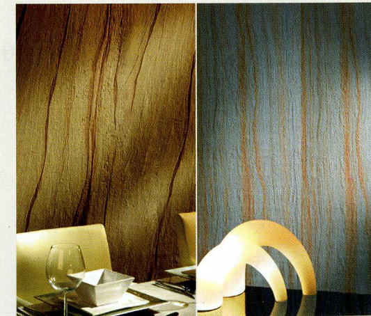
Wände zu Stein erstarrt. Stoneplex Sand von Architects-Paper.